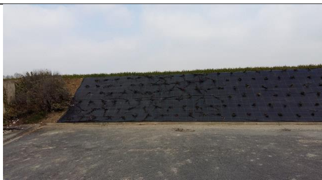
Talus de la Rue des Preux

Le conseil municipal a fait réaliser les travaux votés en Septembre dernier