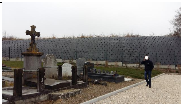
Talus du cimetière